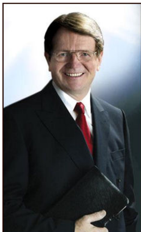
Reinhard Bonnke Gospel Crusade

October 08, 2010 Cornerstone Church, 18755 Stone Oak Parkway, San Antonio, Texas 78258 Tel. (210) 490-1600