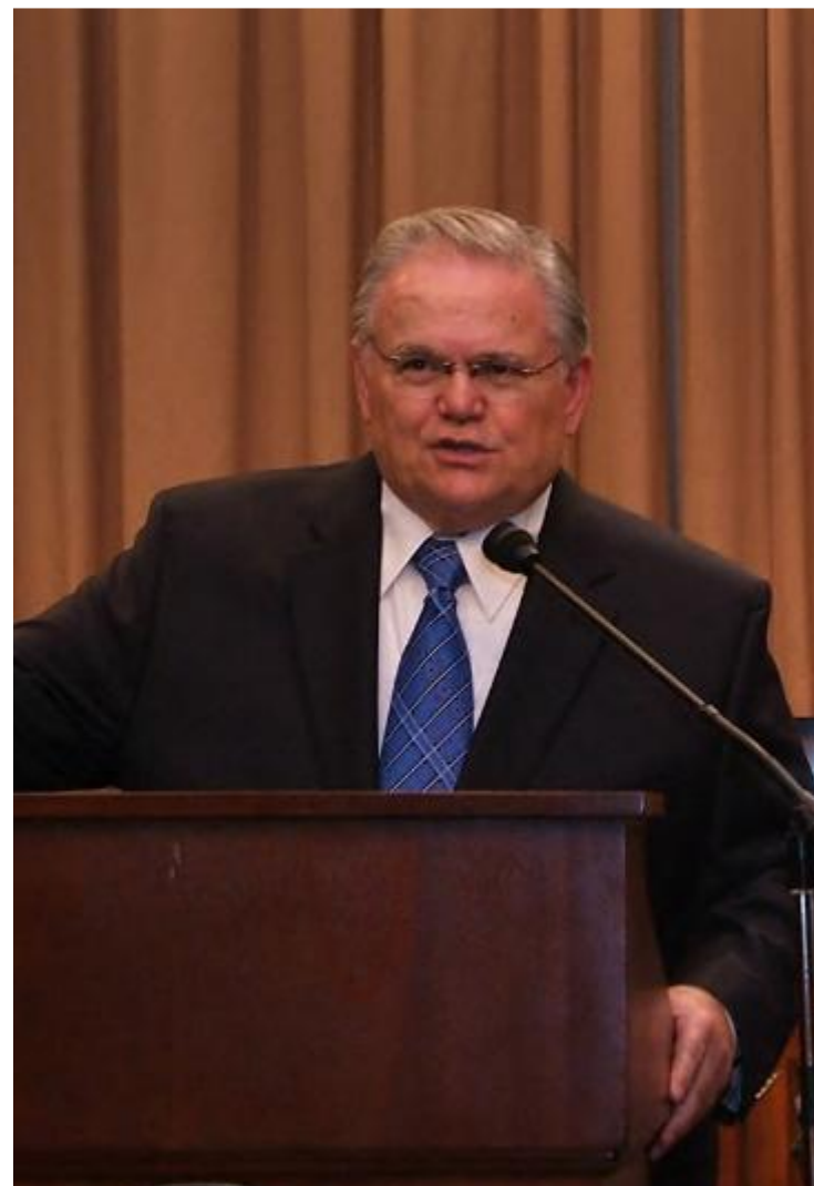
PASTOR JOHN HAGEE 2010 Feast of Tabernacles

October 08, 2010 Cornerstone Church, 18755 Stone Oak Parkway, San Antonio, Texas 78258 Tel. (210) 490-1600