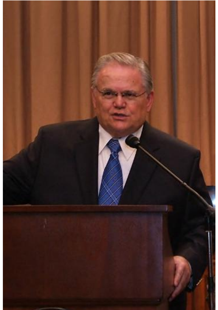
PASTOR JOHN HAGEE 2010 CHRISTMAS PAGEANT & JHM GATHERING OF PARTNERS

December 10, 2010 Cornerstone Church, 18755 Stone Oak Parkway, San Antonio, TX 78258 www.jhm.org