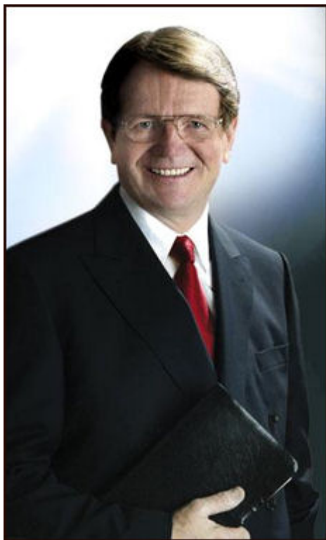
Reinhard Bonnke Gospel Crusade

December 10, 2010 Cornerstone Church, 18755 Stone Oak Parkway, San Antonio, TX 78258 www.jhm.org